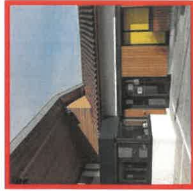
Conception CCV - Impression Imprimerie Moderne